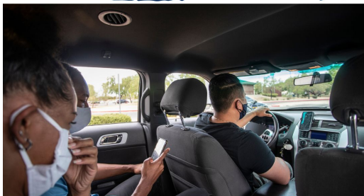
Si tiene que compartir un auto con un compañero de trabajo, utilice tapabocas, garantice una ventilación adecuada, y utilice gel desinfectante.