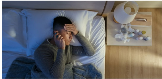
Si tiene síntomas de COVID-19, hable con su jefe, quédese en casa y consulte con un médico.