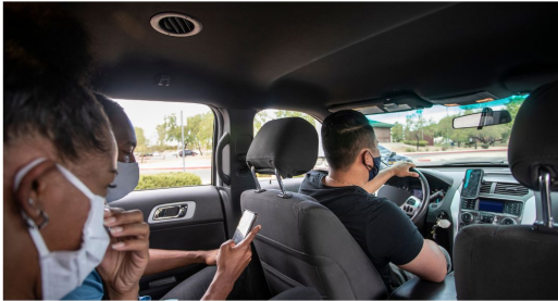
If you have to share the same car with a co-worker, wear a mask, ensure adequate ventilation, and use sanitizing gel.