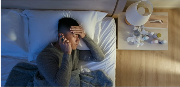
If you have symptoms of COVID-19, talk to your boss, stay home and see a doctor.